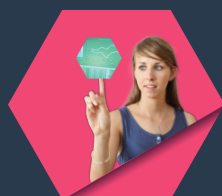
GÉNIE DES PROCÉDÉS